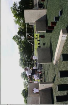
Parkour, Bewegung und Fitness