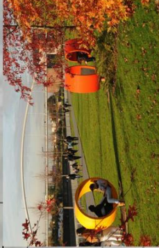
Sonnenwiese: Erholung und Entspannung